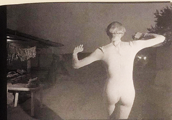
2016 Video multi-channel video installation, total time 9 min in a loop Files: MOV, 16-9, 1080p

Relativitätstheorie. Das Video zeigt karnevalistische Formen, heidnische Mystik und mittelalterliche Fleischlichkeit in verschiedenen typischen Situationen: Fest, Hochzeit, Pilgerfahrt, Markt, Opfer, Wechsel der sozialen Rollen, Initiationszeremonie, Hexensabbat. Die intensive soziale Landschaft wird durch meditative „Elektro-